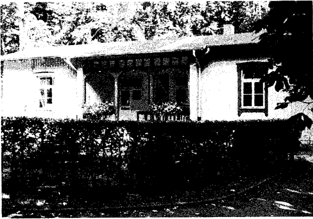
Abbildung 1: „Rosenvilla“ im Krankenhaus Tiefenbrunn