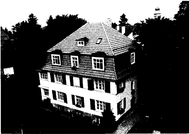
Abbildung 3: Heutiges Therapiezentrum für Kinder und Jugendliche

Für Sie und mich sind dies Orte, die mit Erinnerungen an eine nun schon 30 Jahre währende gute Nachbarschaft verbunden sind. Aus solcher Nähe habe ich miterleben können, was Ratsuchende und Mitarbeiter an Ihnen so sehr schätzen: Ihre Geduld mit schwierigen Menschen und in schwierigen Situationen, die Zuversicht, mit