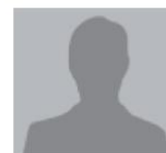
חבר הכנסת, פעיל ימין

במציאות הישראלית הנוכחית סוגיית "דיני הפליטים" מקבלת משמעות מיוחדת ואכן יש לטפל בנושא זה.