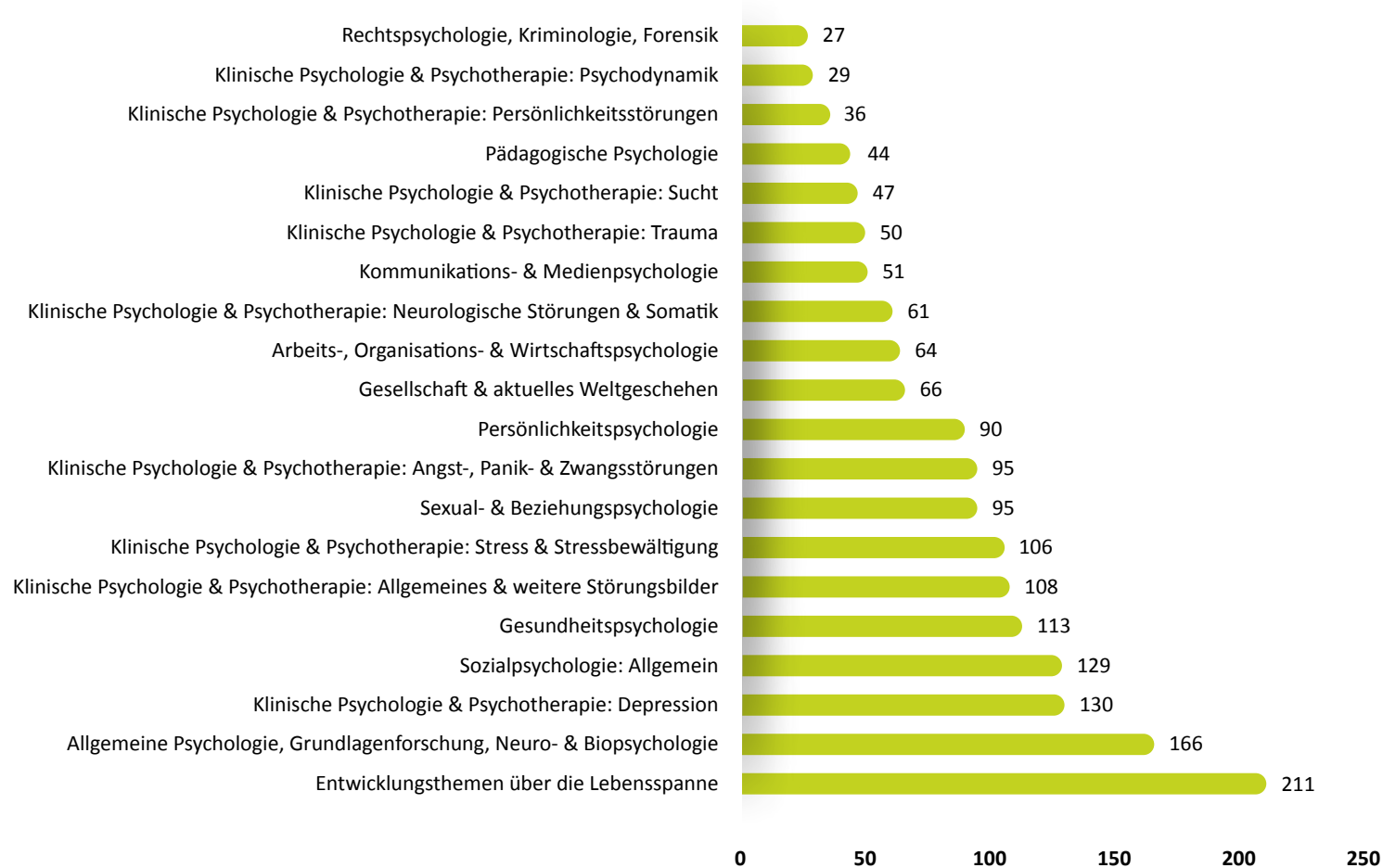
Abbildung 1. Absolute Häufigkeiten der Interessenkategorien